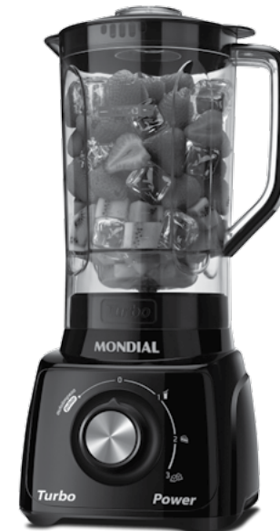
L-99 FB / L-99 FR / L-99 RW L-99 WB / L-99 WG