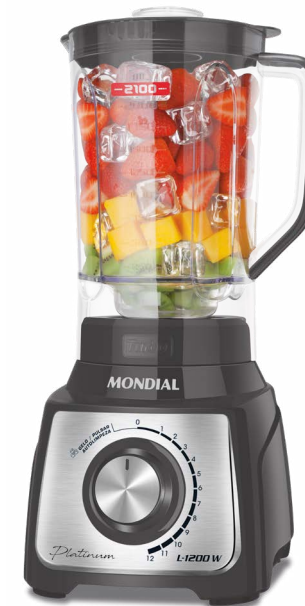
L-1200 MI / L-1200 RI L-1200 WI / L-1200 BI / L-1200 PI