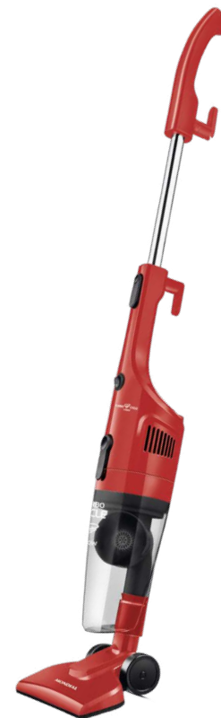
AP-34 / AP-34-BL / AP-35 / AP-36